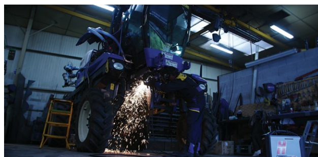
Entretien de machines agricoles