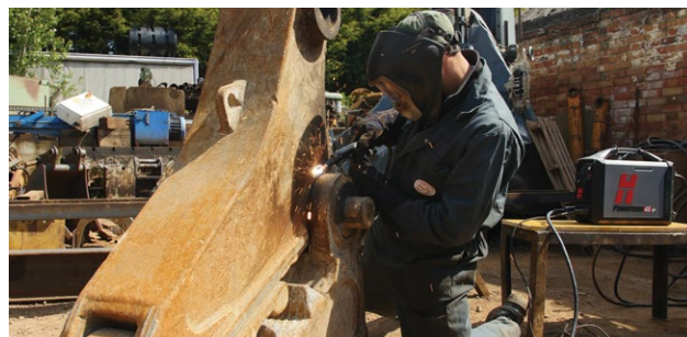
Entretien et réparation