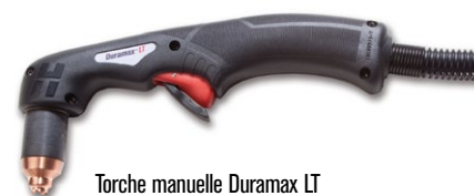
Torche manuelle Duramax LT

(pour plus d'options de torche, consulter www.hypertherm.com )