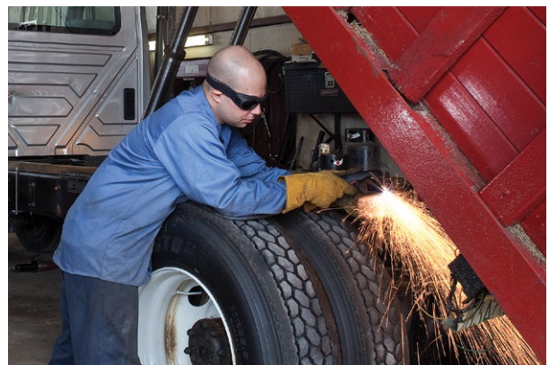
Réparation et modification de véhicules