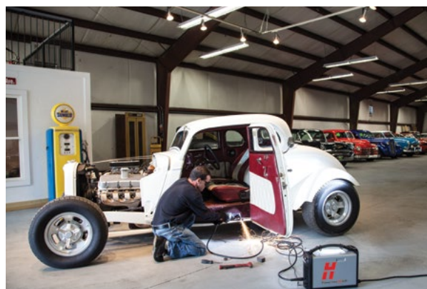
Réparation et modification de véhicules